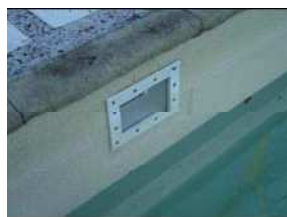
5" pcs (13 cm)