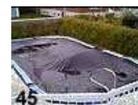
Toile de fermeture